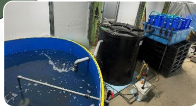
小型養殖ユニット