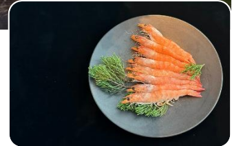
陸上養殖エビ『うるみえび』